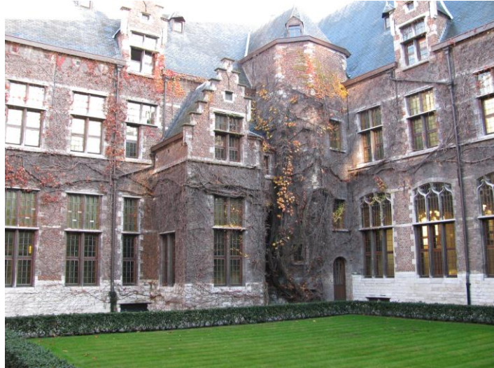
Binnenkoer Hof Van Liere