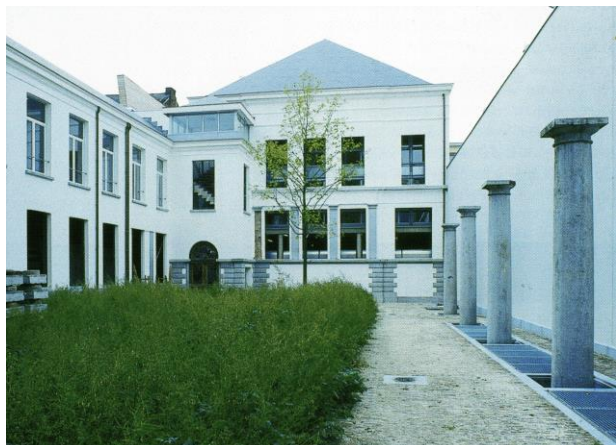
Binnentuin Het Brantijser – St Jacobsmarkt.

... genieten van deze binnenzones, van het samengaan van oud en nieuw, van de confrontatie van modern en oud.