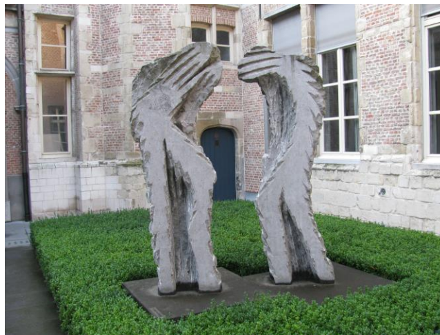
Eugène Dodeigne – twee figuren.

In de loop der jaren heeft de universiteit Antwerpen een mooie collectie kunstwerken opgebouwd, door schenking, door aankopen en door bruiklenen.