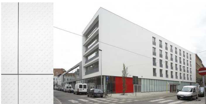
Gebouw - De Meerminne

Ze verwierf ook belangrijke historische gebouwen en restaureerde die met de grootste zorg en respect voor het historisch erfgoed tot moderne en functionele locaties.